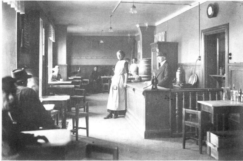
Gula Knuten, interiör från början av 1900-talet.