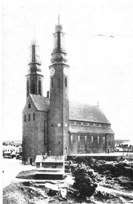
Högalidskyrkan vid tiden för invigningen 1923. Arkitekt var Ivar Tengbom.

När Högalidsnamnen sattes hade man inga planer på att placera en kyrka på Högalidsberget. Nej, den kyrka som man sedan 1860-talet hade tänkt bygga på västra Södermalm skulle stå på ett berg längre österut. Det berget fick därför 1885 namnet Ansgarieberget och gatan intill (som i någon mån motsvarade den gamla Hornskroken) kallades Ansgariegatan. I ett bostadshus där (Brännkyrkagatan 88), som ägdes av det sociala hyresbolaget Manhem, inreddes en kyrksal. Huset stod kvar i den äldre gatulinjen och på den utskjutande brandgaveln målades ett kyrkfönster. Att lokalen åstadkommits genom att ta bort tross-