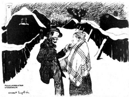
Tegelviksgatan tecknades 1894 av Albert Engström, Bobban och "pigeschan från landet" kom in i bilden tre år senare.