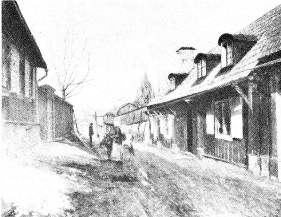
Från Stigbergsgatan, oljemålning av Victor Forssell 1890. I bakgrunden Katarina kyrka.

Kring Äsöberget och vid Kvastmakarbacken sågs en tid ett märkligt litet flyttbart hus. Det har ansetts vara Sveriges första rörliga ateljé och liknade väl närmast en senare tids korbstånd. Det lilla huset var vinterbonat, hade fönster och var försett med fotogenkamin. Inuti satt uppfinnaren själv och målade det han såg utanför rutorna. Ungarna kände nog inte igen konstnären — som annars var en mycket känd man. Det var prins Eugen som på detta sätt inledde sin karriär som landskapsmålare. En av hans första målningar med Stockholmsmotiv, från Äsöberget, gav prinsen i