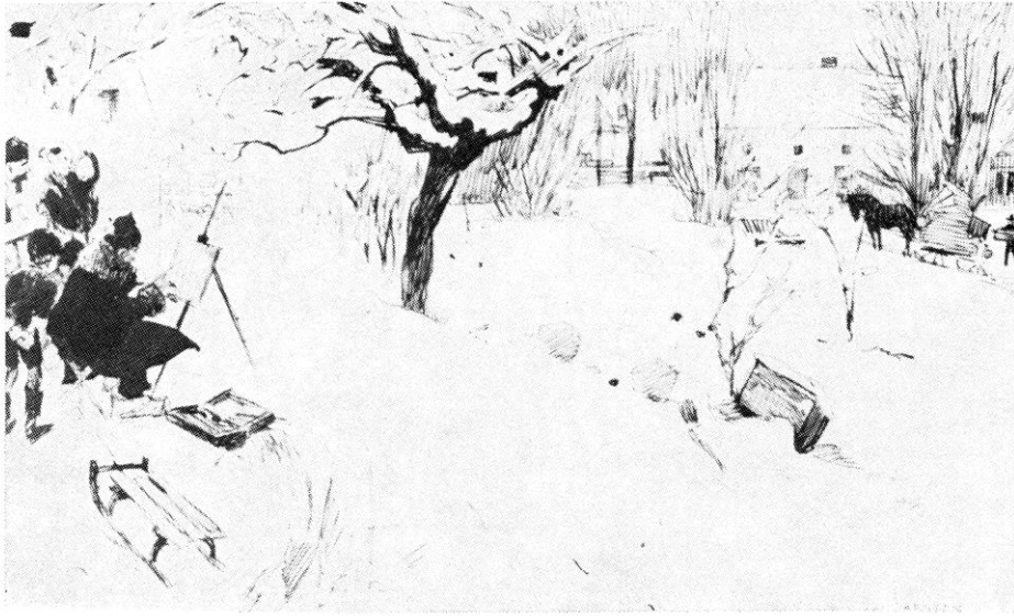
Carl Larsson målade "Friluftsmålaren" i trädgården vid Åsögatan (i kvarteret Lotsen) 1886. Bilden ovan är en förstudie utförd i tusch.